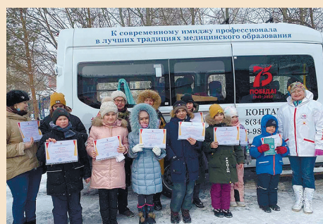
Участники итогового мероприятия проекта

«Современная терапия: новые подходы и актуальные исследования» и заслужили высокую оценку.